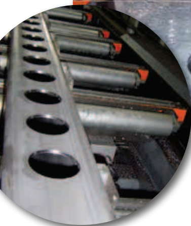
Tube 200 x 100 x 6