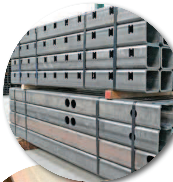
Tube 250 x 150 x 5